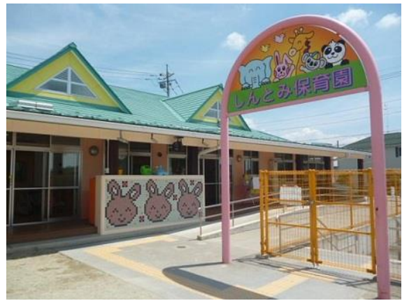
見学で伺った、しんとみ保育園