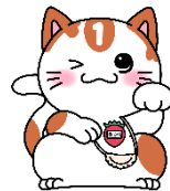
マスコットキャラクター 「ほいにゃん」