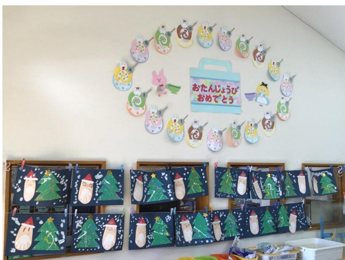
各クラスに子どもたちのクリスマス製作が飾られていました。