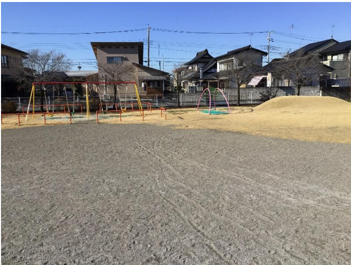
園庭がとても広く、固定遊具の他に築山が2か所あり、子どもたちがのびのびと遊べる環境が整っています。