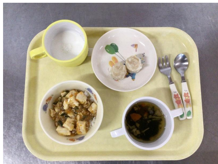
1歳児の給食です。おいしそうに笑顔で食事をする子どもたちの姿がみられました。