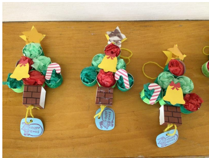
子どもたちが製作したクリスマスツリーです。 Happy X'mas のタグは、先生が作った消しゴムはんこを使用しています。