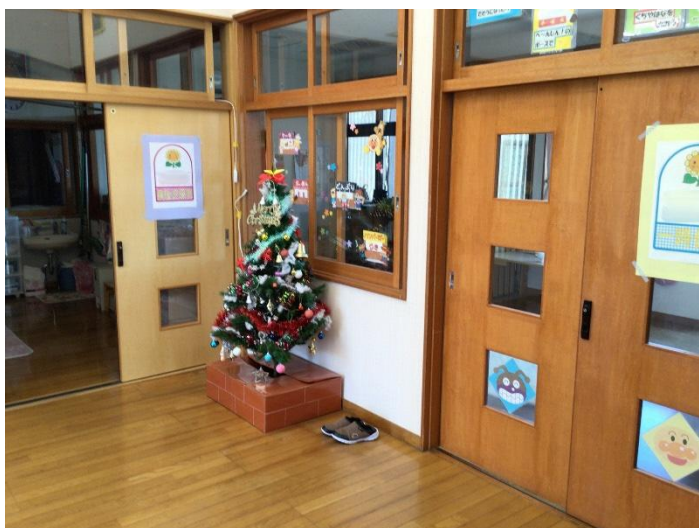
病後児保育室と一時預かり室です。病後児保育は看護師が、一時預かりは専任の職員が対応しています。