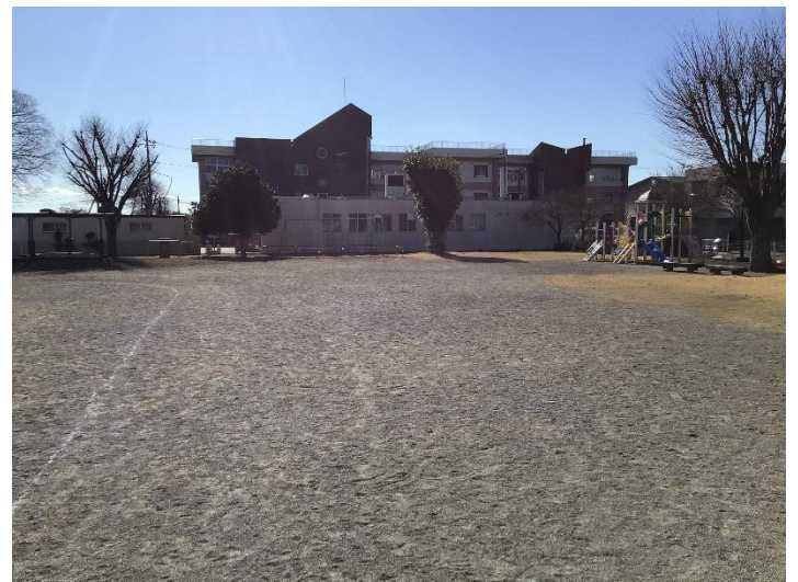
園庭から芳賀東小学校が見えます。卒園児が多く通っており、園児がお散歩に行くこともあるそうです。