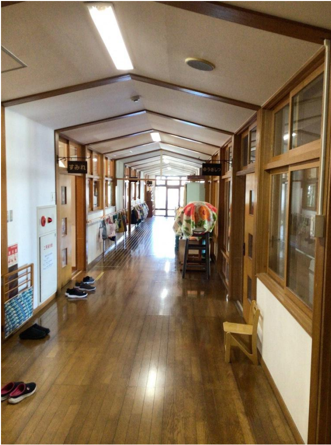
左手前から1歳児クラス～4歳児クラス、右手前から5歳児クラス、遊戯室と見通しの良い廊下でつながっています。