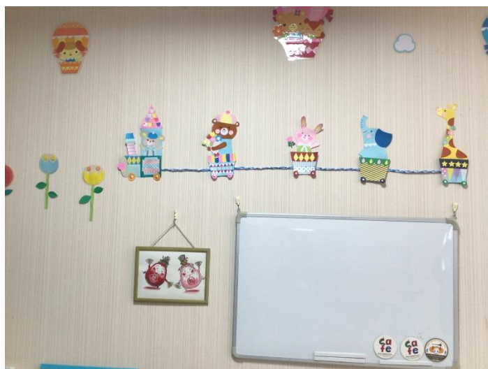
園内は、それぞれの場所に合わせた先生たち手作りの壁面装飾がされています。 こちらは、図書コーナーの装飾です。