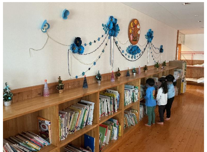
図書コーナーでは、子どもたちが好きな絵本をえらんでいました。