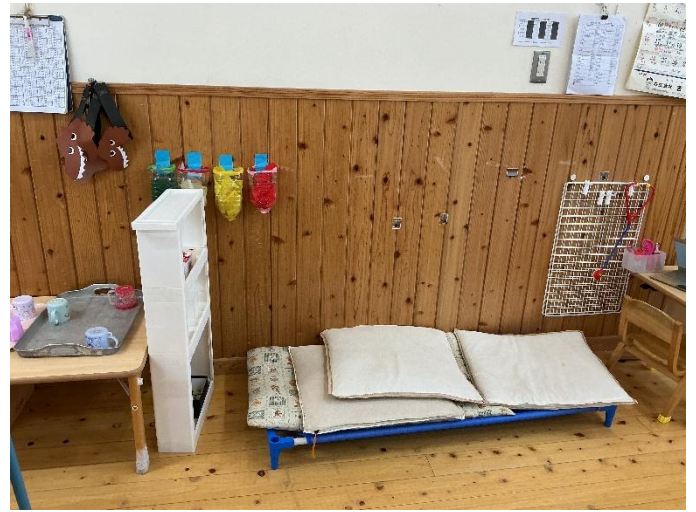
ドリンクコーナーとお医者さんコーナー。