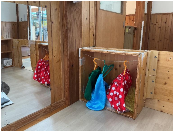
本物の衣装と姿見があるなりきりコーナー。