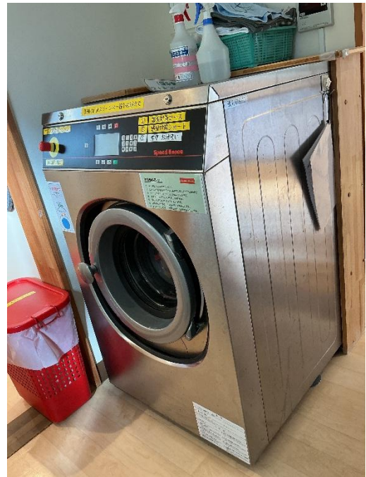
感染症対策として、汚物除去機を設置しています。