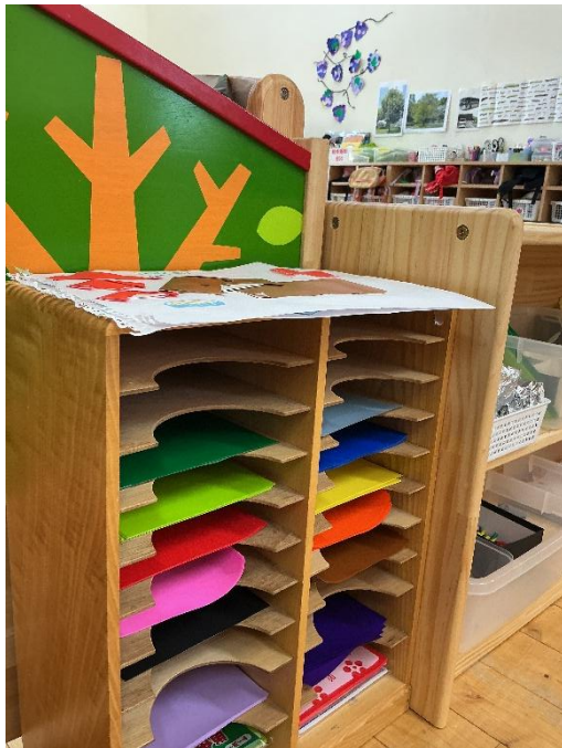
自由につかえる折り紙コーナー。