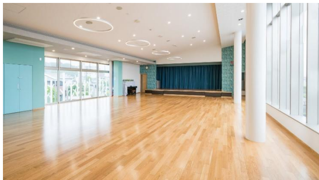
広々としたホールは、様々な行事や活動に使用。室内でものびのびと遊べます。