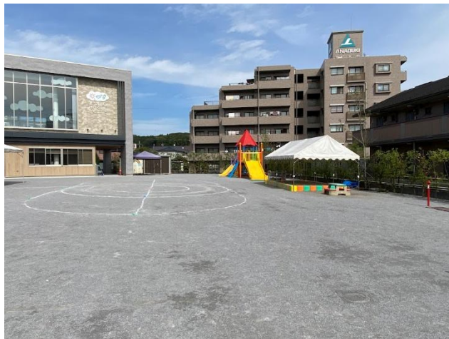
広い園庭では、運動会にむけて準備がすすんでいました。

職員間で、常に連携を意識し、日常的に「報告・連絡・相談」を心がけ、もしもの時は担任だけで悩まずに、園長・主任がサポートしますので安心して働けます。男性保育士は今のところおりませんが、ぜひご応募ください。