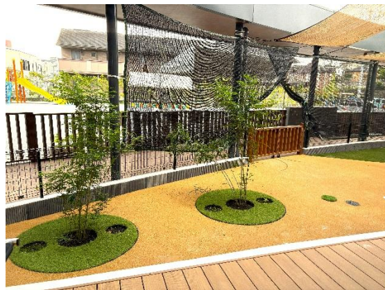
自然を感じる中庭で、夏の間はプール遊びを楽しみました。日よけがあり安心して遊べます。