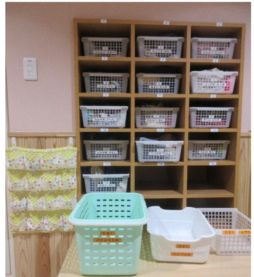
保護者は保育室に入らずに衣類の補充ができます。