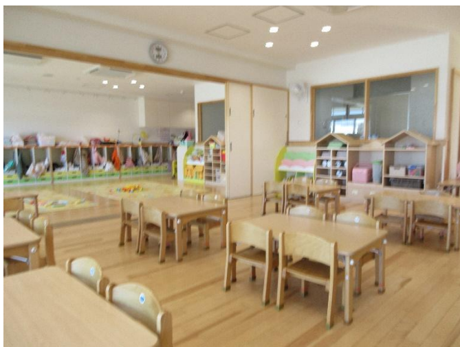
1歳児・2歳児保育室は南園舎にあります。