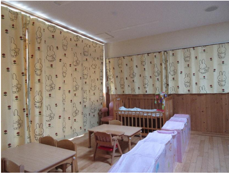
0歳児ほふく室兼夜間保育室