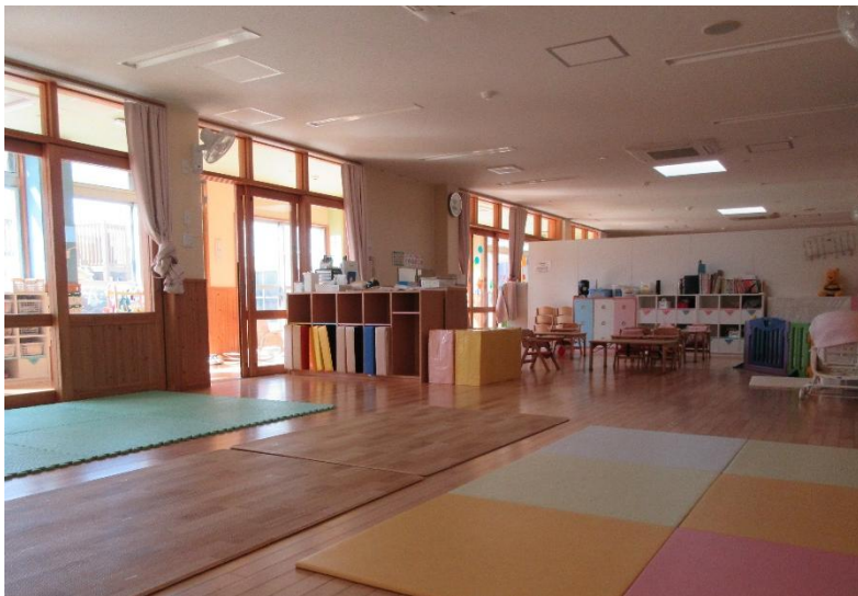
0歳児29名は月齢によりクラス分けをしています。