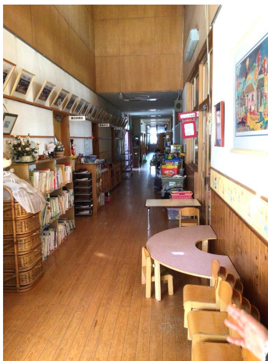
職員室から乳児室までつながっており、園の様子がよく分かる作りとなっています。