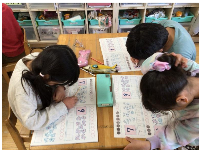
午睡の無い日は文字ワークをしています。