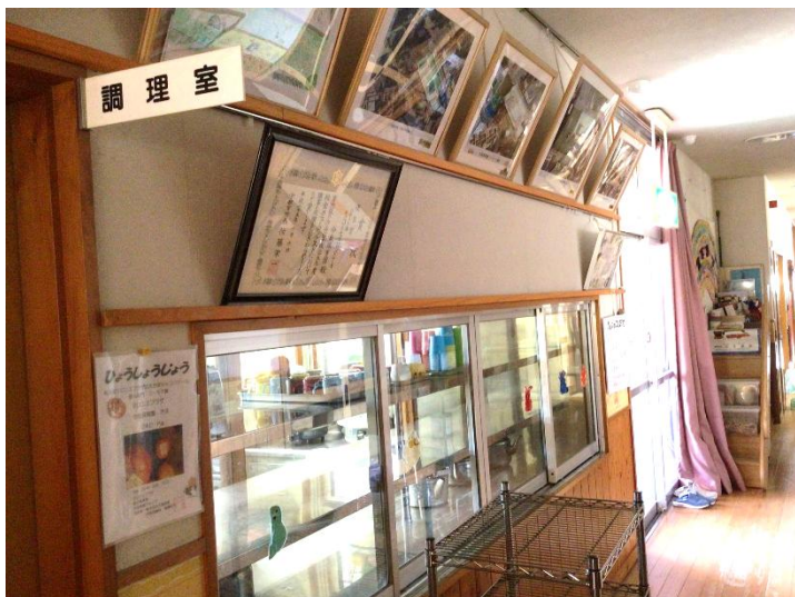
保育室のある給食室。調理の様子が見られます。