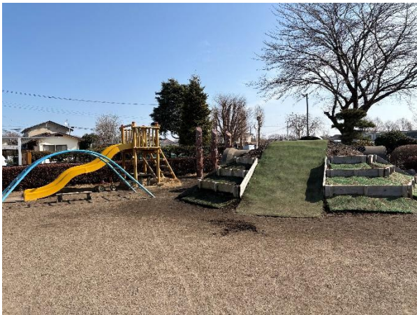
園庭にはつき山がありました。