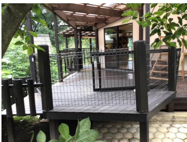
0～2歳児が生活している乳児棟です。