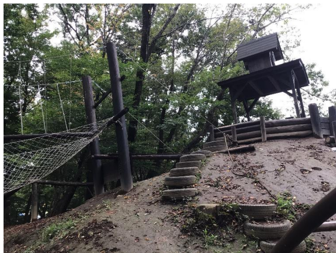
広い園庭には素敵な遊具がたくさん！自然を感じながら伸び伸び遊ぶことができます。