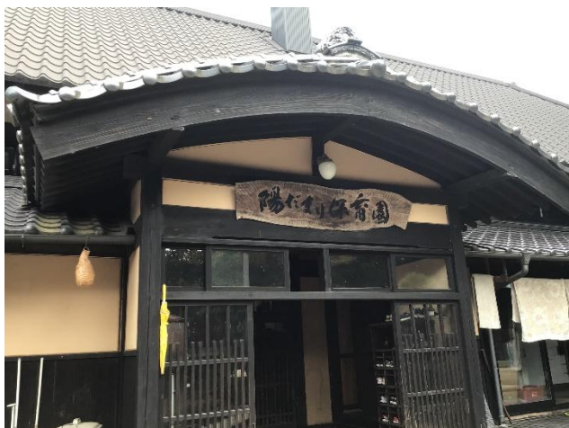
和の雰囲気漂う素敵な入口です！